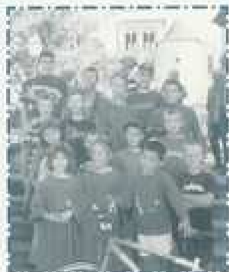
Concours des jeunes 22/07/2007.

Le 22 juillet 2007, la Gaule Chambonnaise a organisé son traditionnel concours de pêche à la ligne...sous le soleil.