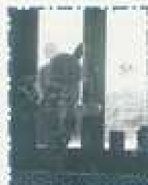
Un invité surprise.