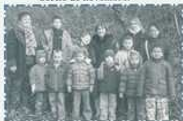
Sortie de novembre.

Le centre aéré Les Bambis poursuit sa mission d'accueil des enfants du territoire dans le but de répondre aux besoins des familles. Cet objectif se double d'une volonté d'offrir le maximum de bien-être, de plaisir, de confort, de sécurité aux enfants grâce à des animations, des sorties, et des activités adaptées à leurs besoins.